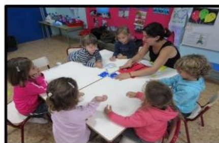
Grup Interactiu "Els nostres noms"