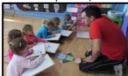
Grup Interactiu "Esquema corporal"