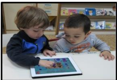
Taller de "i-pads"