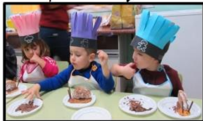
Taller de cuina

Hola a tots i totes, a les classes de 3 anys estem fent moltes activitats divertidíssimes com els TALLERS I GRUPS INTERACTIUS i amb les que estem aprenent moltes coses. Per fer-les venen a ajudar-nos mares, pares i voluntariat i és per això que els volem donar les gràcies per vindre a jugar amb nosaltres.