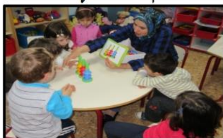
Grup Interactiu "joc matemàtic"